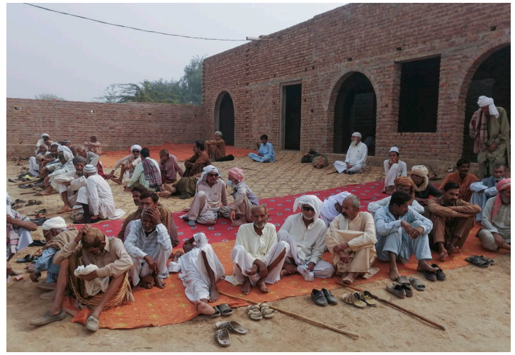
Augenpatienten im Wartezimmer einer Dorfklinik