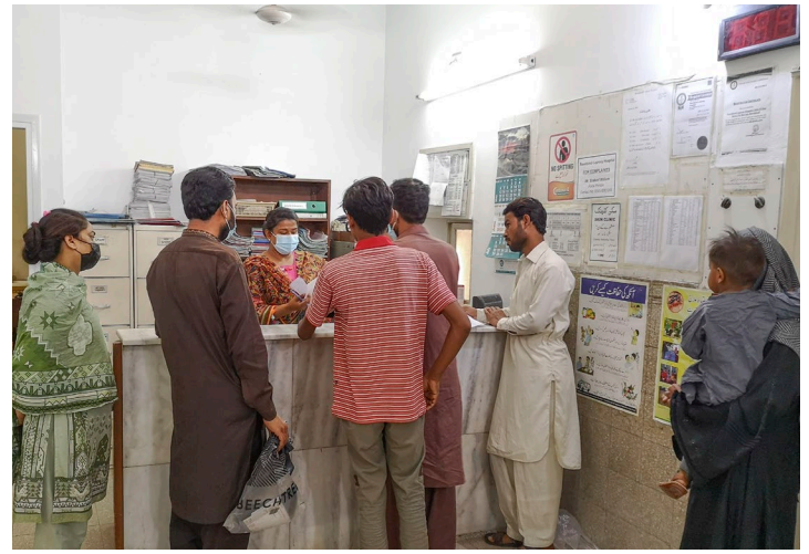
Andrang bei der Anmeldung zur TB-Kontrolluntersuchung

Für Sr. Annette passt das Bild des Säens im wörtlichen Sinn. Sie ist neben dem Hausmeisterbereich für unser großes Gelände verantwortlich, u. a. auch für die Felder. Wegen der enormen Inflation von derzeit fast 40% sind wir sehr dankbar, dass wir viel Gemüse selbst anbauen können für die tägliche Versorgung der Patienten und der Kinder.